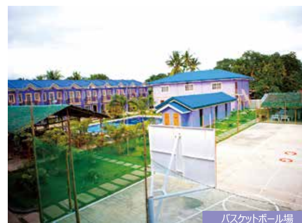
バスケットボール場