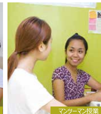
マンツーマン授業