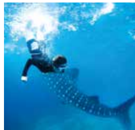
From. Banilad Nemo

If you want to study English in an environment where there are not many Japanese, I recommend CG. These past 12 weeks were precious experiences for me.