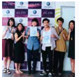
From. Banilad Noah

CGに来てから約4ヶ月が経ちました。時間の流れは遅いようでとても早かったです。初めてのCGに来た時、私は英語で挨拶をすることしか出来なく、この先のCG LIFEに不安を感じていました。僕が、不安を感じ生活している一週目、僕の不安を解消させてくれた出来事がありました。英語が喋れない僕にも関わらず、韓国人の友達が僕を旅行に誘ってくれました。もちろん、そこでは英語しか通じないわけであってとても大変でしたが、彼らが僕に英語がわからなくてもとにかく頑張って話せば、相手に言いたいことが伝わると言うことを教えてくれました。そこで、僕の不安はなくなりとにかく積極的に英語を話せるようになりました。僕の英語が間違っていればみんな正しい文に直して教えてくれたりと、とても親切な人ばかりでの皆様には感謝しきれません。僕がCGに来て英語に対して感じたことは、とにかく、とにかく人と会話して会話することが一番の英語の上達方法だと感じました。人それぞれ自分の中でよく使う英単語があると思います。僕が思うには同じ場所に住み生徒は僕の兄弟でオフィスは僕の親のようでした。他の学校と比べ、みんなの距離が近かったと思います。それはCGのルールが厳しいからこそだと思います。