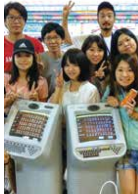
From. Sparta Sky

I had a nice time in CG for 1month. CG has strict rule that pushes me to study. For example, EOP(English only policy), and I can't go out during week days. I think that I can't have the chance to put myself in this strict environment again. You may think "Isn't it too strict?," There are humorous teachers, a lot of friends from other countries, cheering each other, and having some time to play made me not to think that it's hard to endure. I can study English practically, different from the one that I can learn in Japan. So, I could get TOEIC score surprisingly higher than before. Thanks to everyone in CG. If you're hesitating, I recommend you to study in CG!