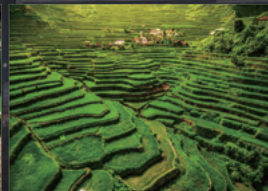
天国への階段の異名を持つ世界遺産 バナウエの棚田