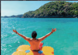
シュノーケリングが楽しめる ハンドレッドアイランド

バギオ市内には遊びの誘惑は少ないですが、周囲にはビーチリゾートや世界遺産など魅力的な観光地がたくさんあります。せっかくの海外留学、週末は仲間と一緒に観光を楽しみましょう。