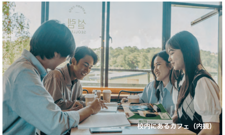
校内にあるカフェ（内観）