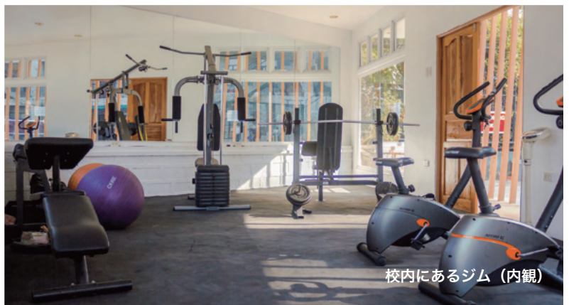
校内にあるジム（内観）