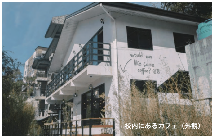
校内にあるカフェ（外観）