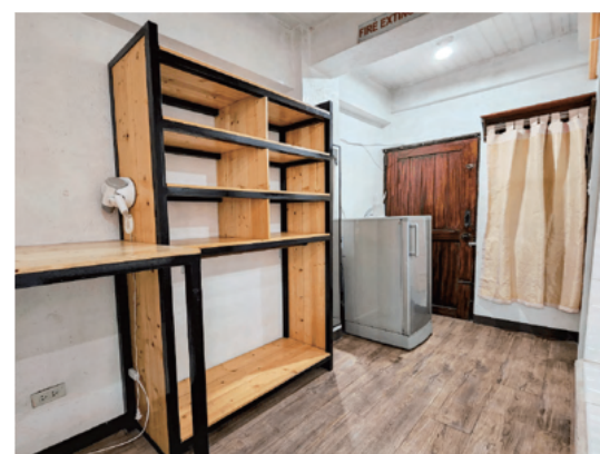
スタジオタイプ4人部屋 (設備)