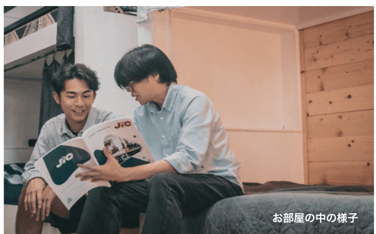
お部屋の中の様子