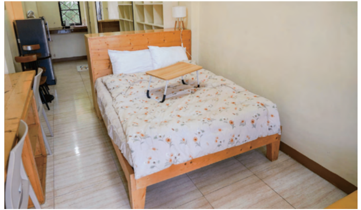
スタジオタイプ1人部屋 / カップル部屋