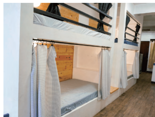
スタジオタイプ4人部屋 (ベッド)