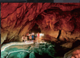
洞窟探検が楽しめる サガダ