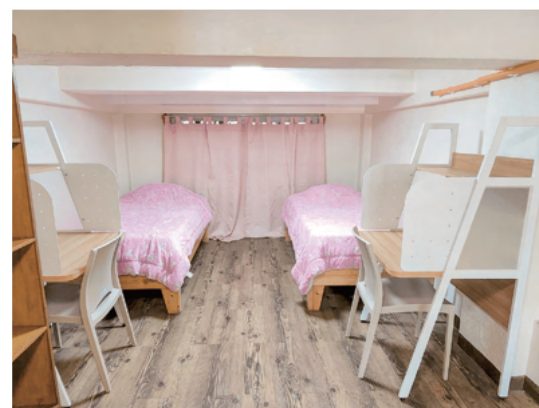
ロフトタイプ部屋 (2階寝室)