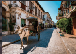
16世紀の街並みが残る世界遺産 ビガン