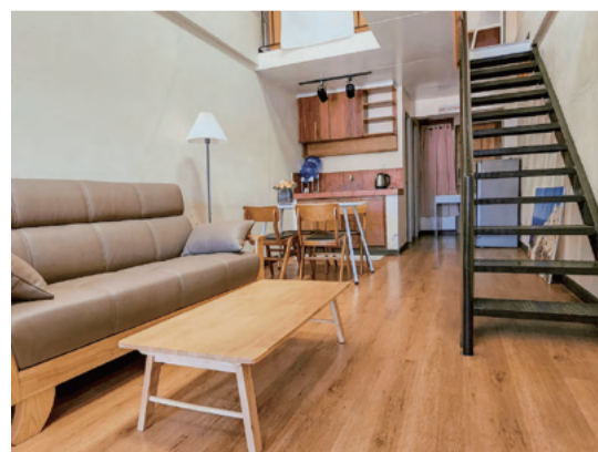
ロフトタイプ部屋 (1階リビング)