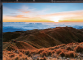
本格的な登山が楽しめる マウント・プラグ