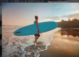
サーフィンが楽しめる サンフェルナンドビーチ