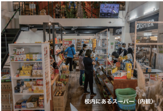
校内にあるスーパー（内観）