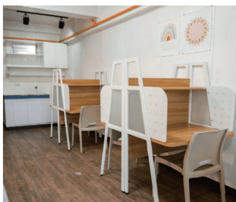
スタジオタイプ4人部屋 (学習机)