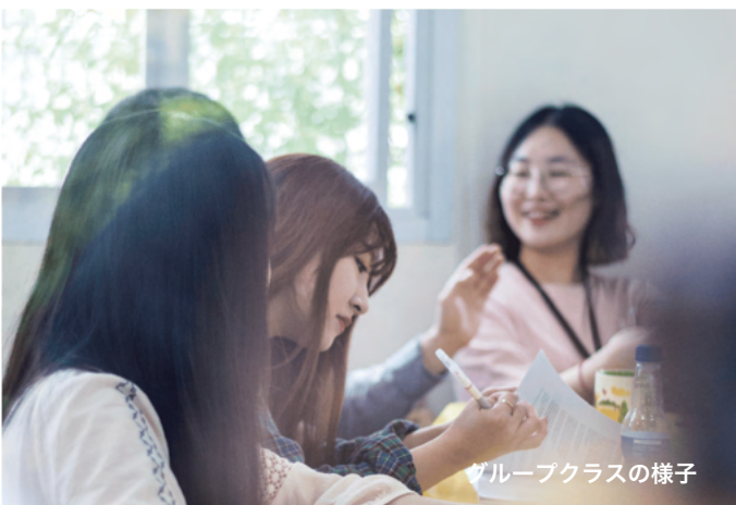
グループクラスの様子