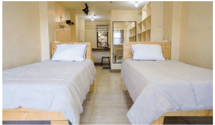
スタジオタイプ2人部屋